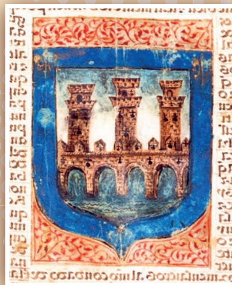
■ Escudo de Logroño en una publicación de 1523.

El escudo podrá ser timbrado cuando proceda con la tradicional corona real abierta, según el acuerdo adoptado en el Pleno.