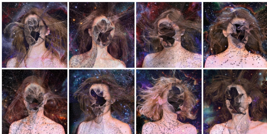
Marina Núñez, Supernovas, 2018

que añaden tiempo y memoria a sus imágenes, o se sirven de las herramientas digitales para crear territorios simbólicos en los que la imaginación se expande como un rizoma. Construyen estructuras complejas de imágenes que apelan a la inestabilidad de las identidades, al carácter mutante de las certezas sobre el pasado y reflexionan críticamente sobre una sociedad que ha situado la impostura como un elemento protagónico en la representación del presente.