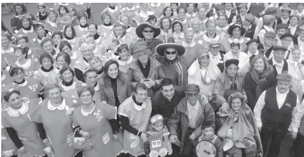
El polideportivo municipal de Las Gaunas acogió la fiesta de Carnaval de las personas mayores

como los personajes del cuento del Soldadito de Plomo. El segundo premio fue para 'Tocando fondo', de la Asociación de Vecinos de Yagüe, Fueclaya, disfrazados de peces; y el tercer premio para '¿Cómo están ustedes?', disfrazados de los Payasos de la Tele, del Colegio Duquesa de la Victoria.