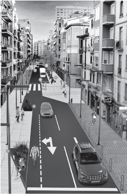
■ La calle República Argentina cuando finalice el proyecto urbanístico.