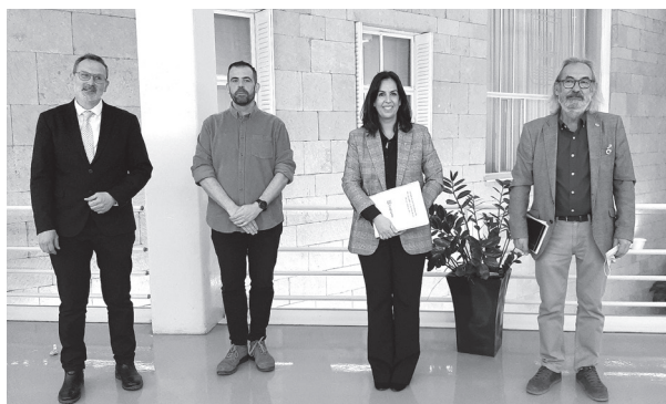
■ La concejala de Economía y miembros del Equipo de Gobierno en la presentación del cierre presupuestario.

Los gastos del Ayuntamiento en 2021 ascendieron a 182 millones de euros, con una ejecución del 86 % en gasto corriente y un 62 % en inversiones, porcentaje muy superior a la media de los años anteriores pese a la pandemia. El remanente con que ha finalizado el año es el