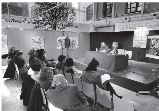
■ Logroño ha acogido, los días 22 y 23 de marzo, el II Encuentro Tejiendo Redes, un programa de intercambio de artistas jóvenes de varias ciudades españolas.