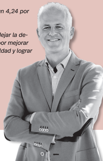
Pablo Hermoso de Mendoza | Alcalde de Logroño

Es la muestra más honesta y real para reflejar la determinación de este Equipo de Gobierno por mejorar la vida de las personas, romper la desigualdad y lograr la justicia social.