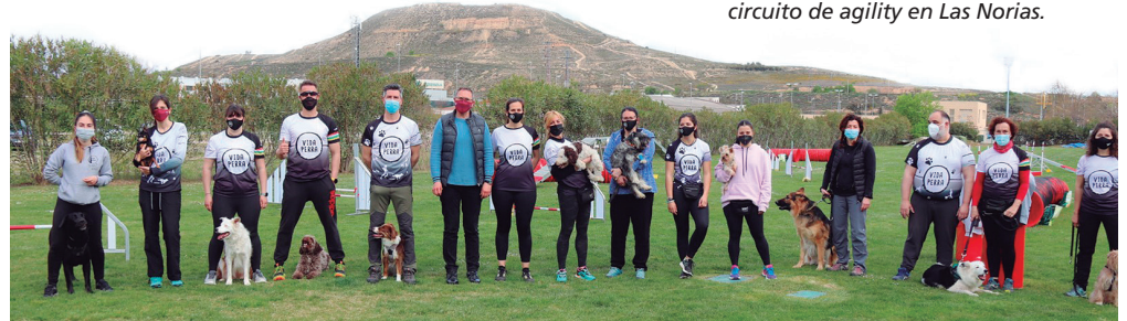
El concejal de Deportes en el nuevo circuito de agility en Las Norias.

El agility es una disciplina deportiva que se practica de forma coordinada entre un perro y su guía. Logroño Deporte lleva impartiendo cursos de introducción y perfeccionamiento de esta actividad desde 2014, contabilizándose ya desde entonces más de 350 alumnos, en una afición creciente. Así lo demuestra el incremento de socios en el Club 'Vida Perra', que imparte las clases, además de desarrollar sus propias actividades. En estos momentos cuenta con 80 so-