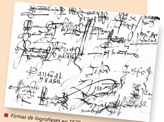
■ Firmas de logroñeses en 1528.