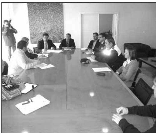
■ La Junta Local de Seguridad se ha reunido esta semana.

Entre otros asuntos, se abordó el debate sobre la incomodidad generada por el comportamiento de algunos de los grupos que acuden a la calle Laurel para celebrar despedidas de soltero. Con la finalidad de minimizar las molestias ocasionadas por este tipo de actividad, el Ayuntamiento ha asumido el compromiso de destinar más agentes de policía a esta zona. La Policía Nacional también acudirá cada vez que se requiera su intervención, según afirmó el