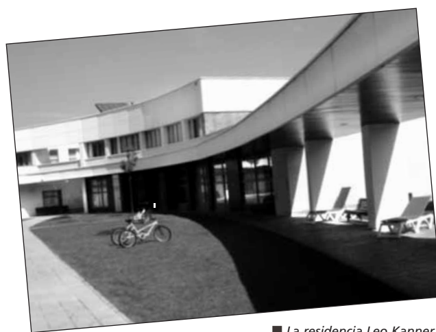
La residencia Leo Kanner, gestionada por ARPA, funciona desde 2008.

ARPA reivindica la integración educativa, laboral y social de las personas con autismo, y pide a las instituciones que presten más atención y destinen más recursos económicos a cubrir las necesidades de este colectivo.