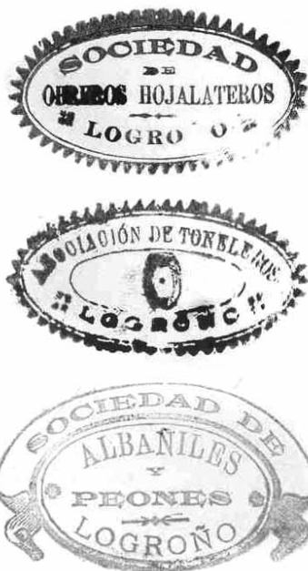
■ Sellos de algunas sociedades obreras logroñesas.

La de Logroño se constituyó en 1904, y tenemos constancia de su funcionamiento hasta, al menos, 1910. Uno de los principales esco-