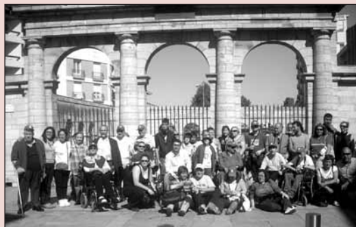
Fotografía del grupo que visitó Dax (Francia).

El pasado jueves 20 de mayo, un grupo de personas con discapacidad, de distintas asociaciones y colectivos, viajaron invitadas por el Ayuntamiento a la ciudad hermanada de Dax (Francia). Los logroñeses recorrieron la localidad en una visita guiada y disfrutaron de un centro termal.