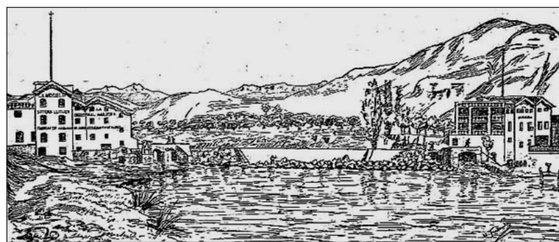
Imagen de la crónica de la inauguración, publicada en La Rioja el 8 de junio de 1910.