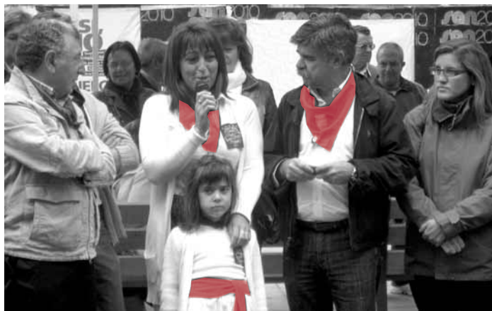
La Peña La Alegría recibió la 'Chuletilla de oro', en reconocimiento a su labor de conservación de las costumbres gastronómicas riojanas.