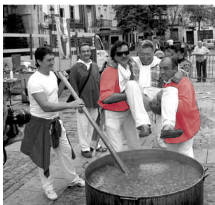
De primero, alcalde con patatas.