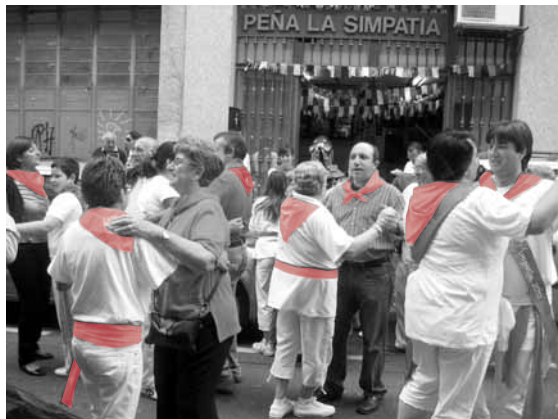
En las visitas a los chamizos de las peñas no faltaron la música ni el baile.