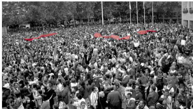
Miles de logroñeses disfrutaron del cohete limpio en la plaza del Ayuntamiento.