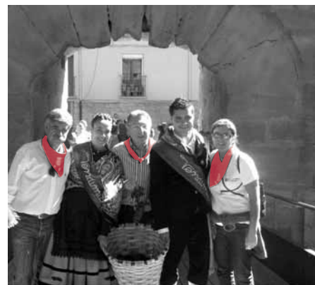
El entorno del Revellín fue el escenario de la vendimia tradicional.