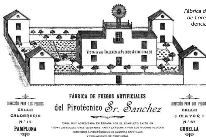
Fábrica de Fuegos artificiales de Corella, en la correspondencia enviada al ayuntamiento logroñés.

No debió convencer a los munícipes y, desde entonces, fueron muchas las fábricas de fuegos artificiales que presentaban sus catálogos y ofertas de artificios pirotécnicos; empresas y fabricantes de diversos puntos de la geografía española (San Sebastián, Bilbao, Durango, Madrid, Pamplona, Segorbe, Zaragoza), incluido en 1908