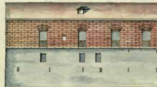
Alzado de la Casa de la Inquisición de Logroño.

La Inquisición papal surge en el siglo XV para combatir la herejía en Europa. En 1498, el papa Inocencio VIII emite una bula en la que se autoriza a nombrar inquisidores en las principales ciudades de Aragón. A mediados del siglo XVI, se crean tribunales del Santo Oficio ubicados en las principales ciudades. El tribunal de Logroño se constituye en 1562 en su anterior sede en Calahorra. El edificio fue habilitado como primera sede del tribunal. Más tarde se construyó el edificio actual, ubicado junto al Convento de Valbuena. La segunda parte de la exposición trata sobre la Inquisición española procedente de la sede de Logroño, con especial referencia a la sede de Logroño. El recorrido se completa con una recreación del tribunal de la Inquisición, en la que se muestran los autos de fe de brujería, herejía e impiedad.