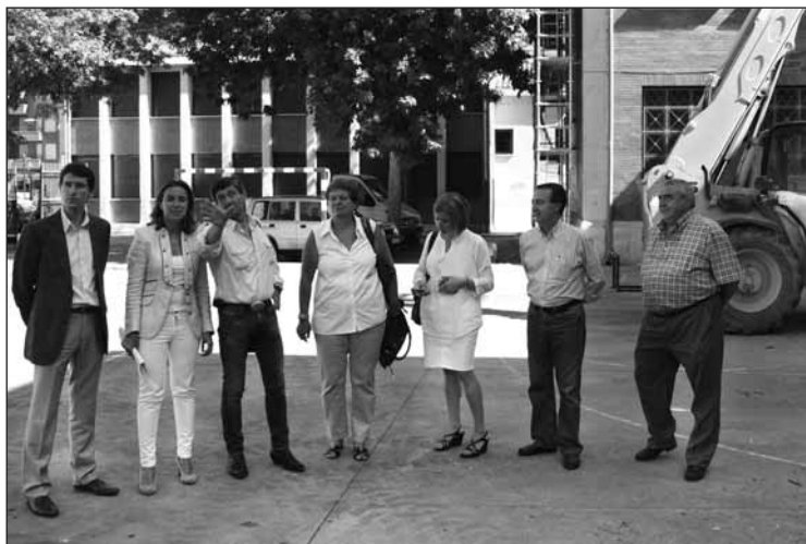
Visita al colegio Vuelo Madrid-Manila.

Cuca Gamarra destacó este programa de inversiones como un ejemplo de la colaboración que debe presidir las relaciones entre las administraciones local y autonómica, además de ser indicativo de que "la educación pública de calidad es una prioridad para nosotros". La alcaldesa de Logroño resaltó así-