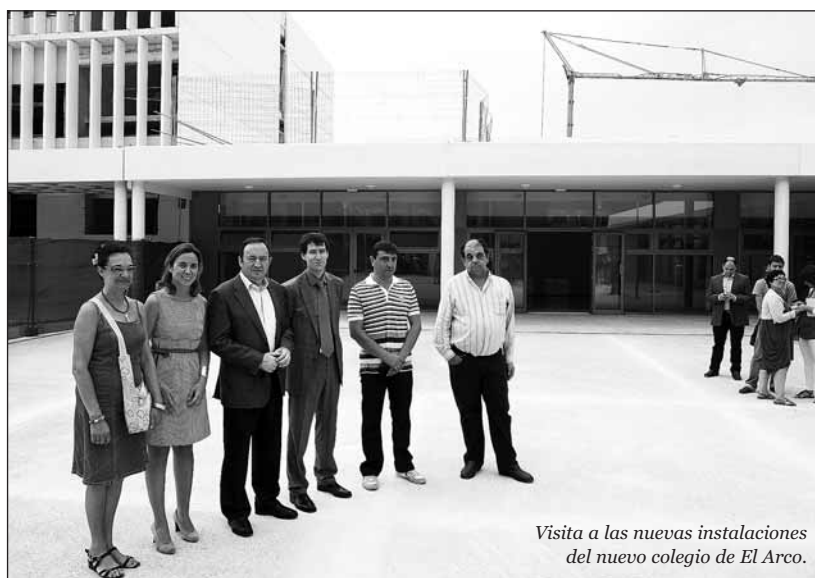
Visita a las nuevas instalaciones del nuevo colegio de El Arco.

Dos días después de visitar las obras que se llevan a cabo en el Vuelo Madrid Manila, uno de los colegios públicos con más historia de nuestra ciudad, autoridades y vecinos recorrieron las instalaciones escolares más recientes de Logroño. El nuevo centro se ha construido en El Arco, en una parcela de 8.500 metros cuadrados cedida por el Ayuntamiento, y en él se iniciará el próximo mes el curso 2012-2013, cumpliendo de este modo las previsiones del Gobierno de La Rioja. Cuca Gamarra agradeció por ello al presidente regional y reiteró su compromiso de colaboración con el objetivo de que "Logroño tenga una educación