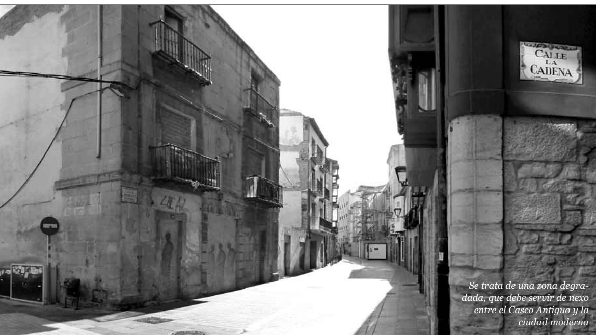
Se trata de una zona degradada, que debe servir de nexo entre el Casco Antiguo y la ciudad moderna