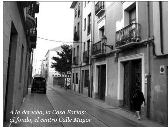
A la derecha, la Casa Farias; al fondo, el centro Calle Mayor

Este cambio supone un nuevo ejemplo de una gestión municipal más eficaz, aprovechando mejor los recursos disponibles. Recordar que a partir del próximo año los empleados de comer-