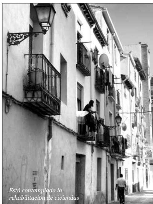
Está contemplada la rehabilitación de viviendas