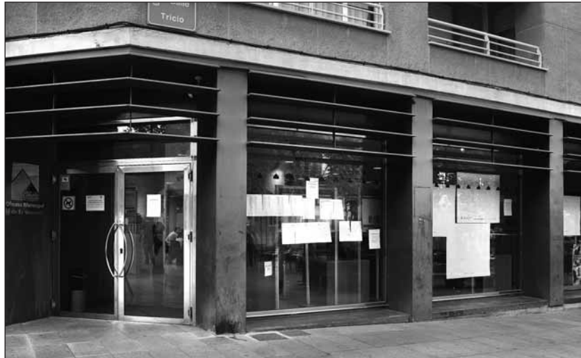
Oficina Municipal de Vivienda, situada en la calle Tricio, en la parte de atrás del ayuntamiento

Esta modificación beneficiará de manera inmediata a los vecinos del inmueble situado en el número 25 de la calle Gran Vía, en cuyo edificio se produjo una explosión de gas. El compromiso del Equipo de Gobierno del Ayuntamiento de Logroño es ayudar en la medida de lo posible a estos vecinos. La ayuda consistirá en un pago de 150 a 250 euros mensuales en función de los ingresos y situación familiar de los interesados durante dos años y concedida por semestres siempre que el contrato de arrendamiento esté vigente. Podrá prorrogarse en casos justificados por un año más. Las bases y la convocatoria para la concesión de subvenciones al alquiler de vivienda en la ciudad de Logroño para 2011 cuentan con tres modalidades diferentes: Renovación, Ayuda