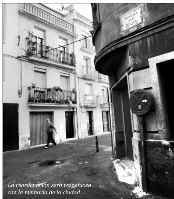
La reordenación será respetuosa con la memoria de la ciudad