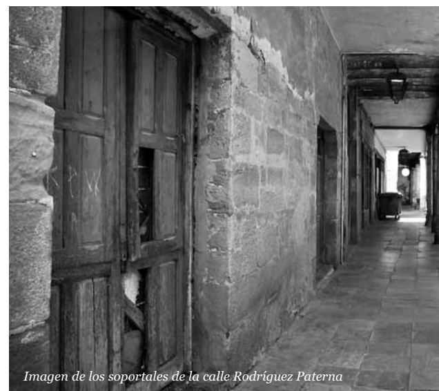
Imagen de los soportales de la calle Rodríguez Paterna

"Les hemos planteado -explicó la alcaldesa- que estudien la reordenación que tiene que