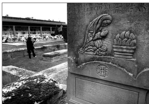
Nichos adornados con flores con motivo de la festividad de Todos los Santos