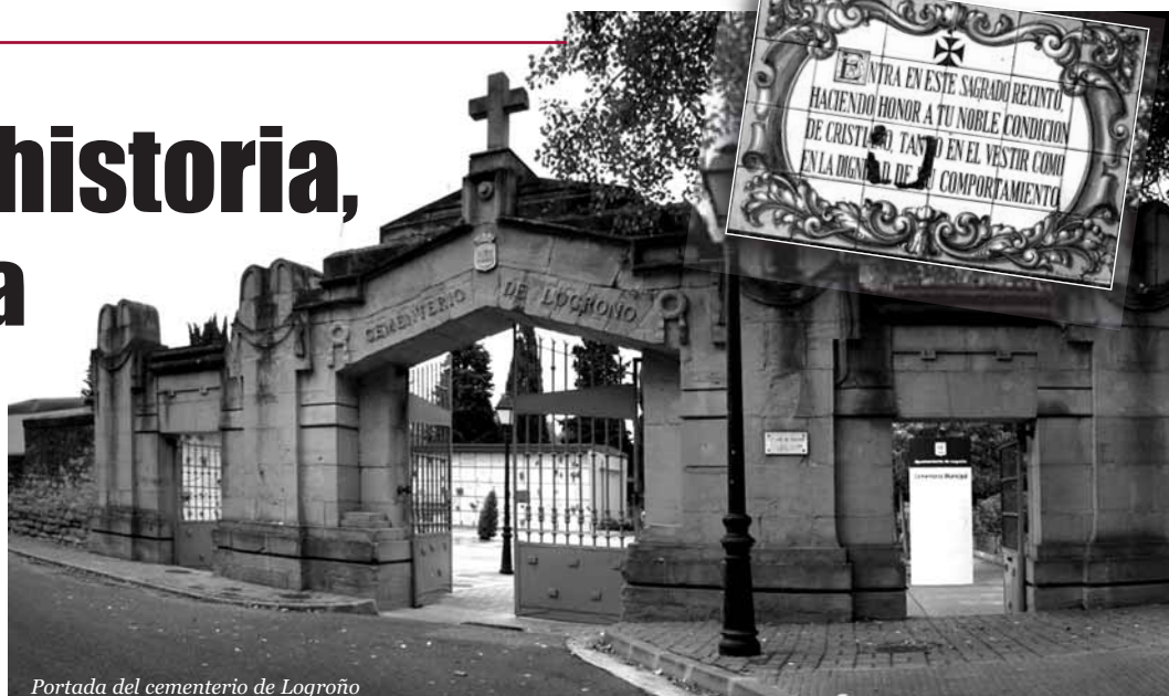
Portada del cementerio de Logroño