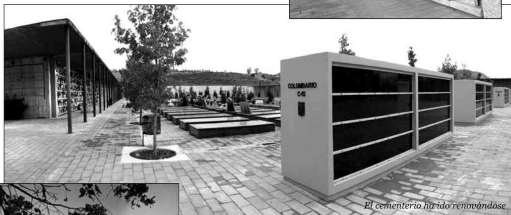
El cementerio ha ido renovándose