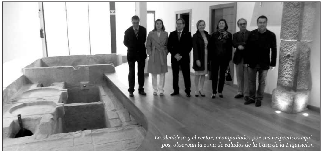
La alcaldesa y el rector, acompañados por sus respectivos equipos, observan la zona de calados de la Casa de la Inquisición

La alcaldesa ha resaltado la confluencia de intereses entre la UR y el Ayuntamiento, desde la "obligación de hacer de Logroño una ciudad