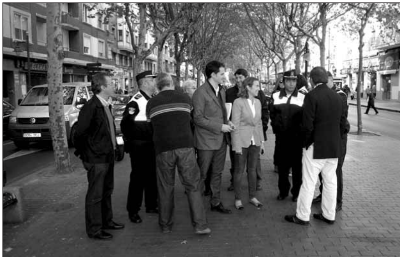
La alcaldesa y concejales recorren Avenida de la Paz acompañados por los policías

Para garantizar una fluida relación entre policías y vecinos se han establecido diferentes canales de comunicación para que los agentes reciban las sugerencias e informaciones de los vecinos. Los agentes repartirán tarjetas con los contactos específicos de la comisaría entre comercios, asociaciones de vecinos, colegios, centros sociales, asistenciales y deportivos.