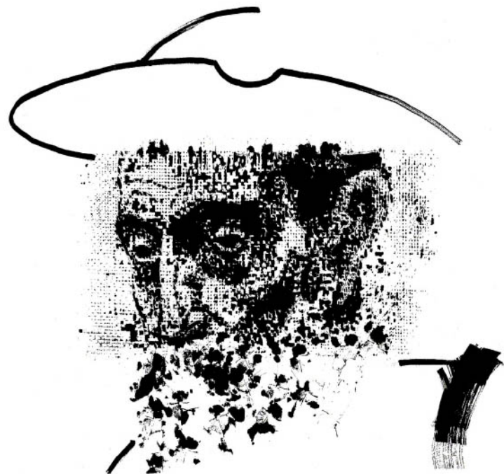
Imagen: Mariano Espinosa (Tinta china sobre papel)