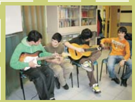
Préstamo de salas