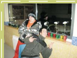
Experimenta las ciencias