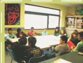
La magia de la escucha