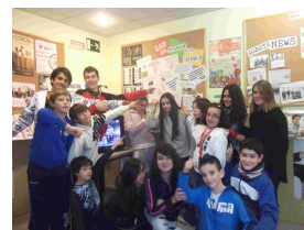
derechos de la infancia