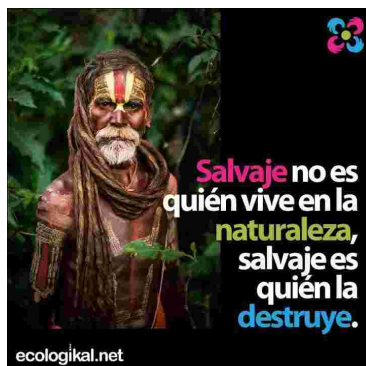
IMAGEN PARA PENSAR