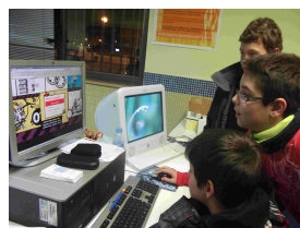
la oca del sida