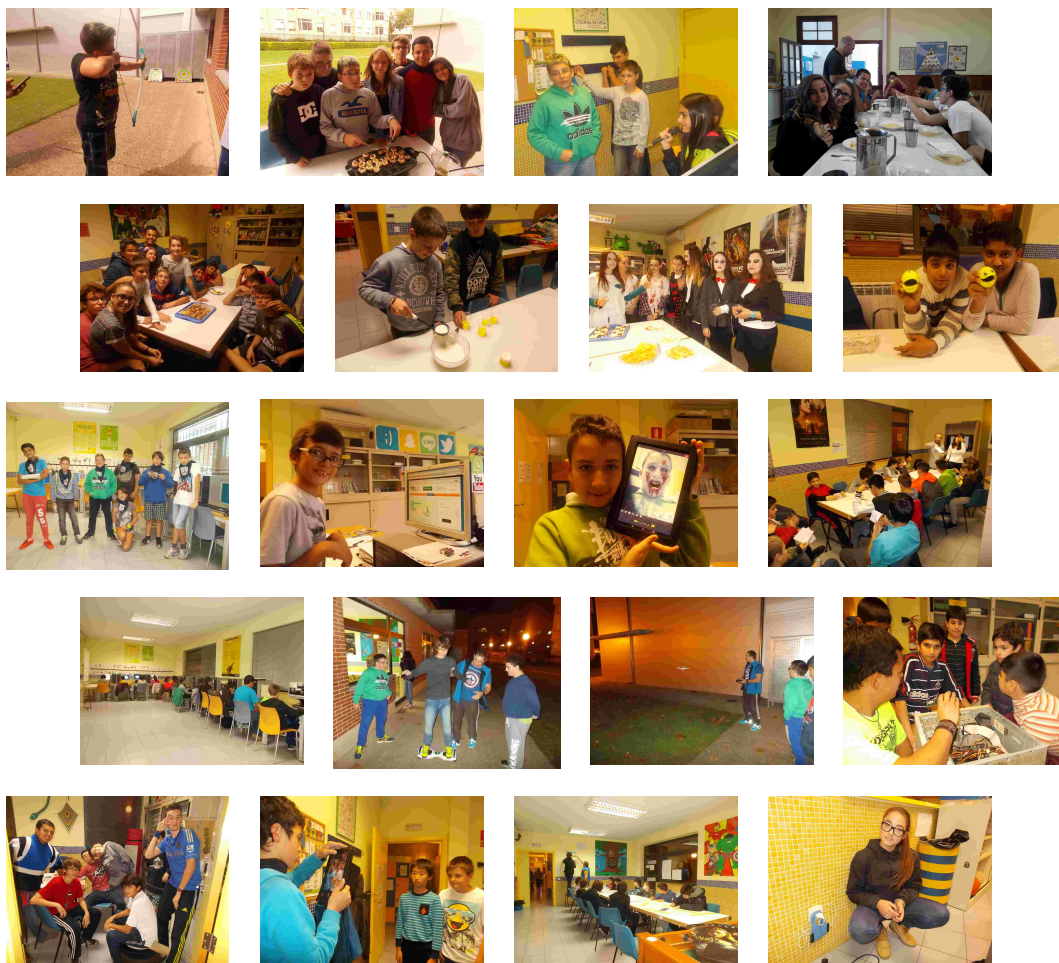
IMAGEN PARA PENSAR

📶 = 5 min 📶 + 📱 = 15 min 📶 + 📱 + 📶 = 55 min 📶 + 📱 + 📶 + 📱 + 📶 = ∞