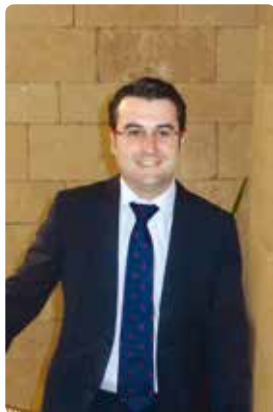
Javier Merino Concejal de Alcaldía, Deportes y Jóvenes del Ayuntamiento de Logroño Presidente de Logroño Deporte