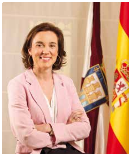
Cuca Gamarra Alcaldesa de Logroño

Este año presentamos un programa que muestra nuestra decidida apuesta por la cultura deportiva saludable, es un compromiso que queremos cumplir con nuestra ciudad. Acercar a los pequeños y a los no tan pequeños a los hábitos y valores como el espíritu de superación y el esfuerzo tan implícitos en el deporte.