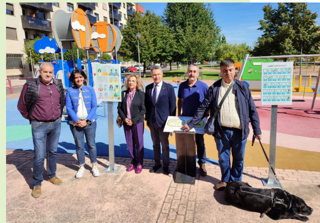
■ Representantes del Ayuntamiento y de colectivos con discapacidad presentaron el nuevo parque.

El objetivo es que este parque se convierta en un modelo a seguir en otros espacios infantiles de nuestra ciudad porque es fundamental seguir trabajando para implementar medidas que hagan de Logroño una ciudad cada día más inclusiva donde todos los niños y adultos puedan disfrutar sin limitaciones. Este parque es una realidad gracias a la colaboración de Fundación ONCE, Asociación de Personas Sordas y el Comité Español de Representantes de Personas con Discapacidad en la Rioja (CERMI).