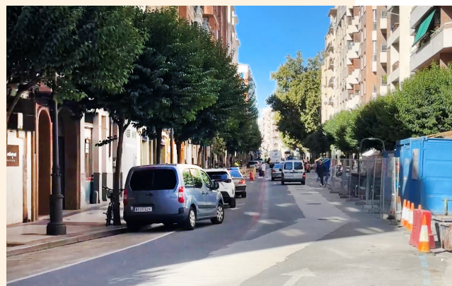
Las obras en Duquesa de la Victoria avanzan.

De esta forma, se mantiene la hoja de ruta prevista y se siguen dando pasos para que la actuación esté finalizada completamente este año, tal como marca la concesión de fondos europeos para este proyecto. “Un proyecto que hemos mejorado respetando la finalidad de los fondos, realizando un intenso trabajo de participación con vecinos y comerciantes y que después se ha plasmado siguiendo los criterios técnicos para garantizar que