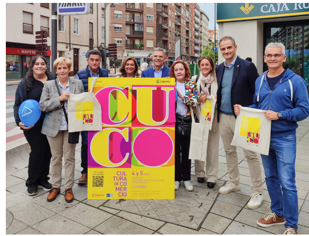
■ Preentación del programa en la zona Oeste.

Un tren turístico recorrerá la zona ZOCO, de 11:30 a 13:30 horas y de 17.30 a 19:30 horas y tanto el viernes de 17:00 a 20:00 horas como el sábado de 11:00 a 14:00 horas y de 17:00 a 20:00 horas se repartirán raciones de palomitas . Además, en la plazoleta Valcuerna se habilitará un servicio de ludoteca (de 17:00 a