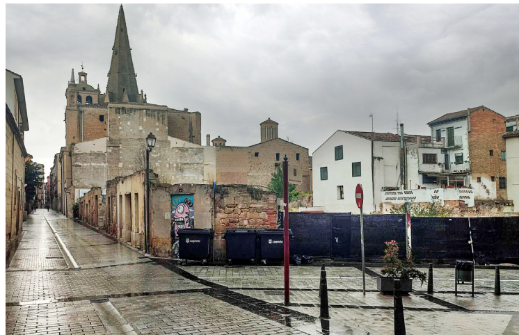
■ Solar de Marqués de Vallejo que albergará la nueva sede de Bosonit.

A partir de la firma del convenio, la empresa tendrá un plazo de cinco días para desis-