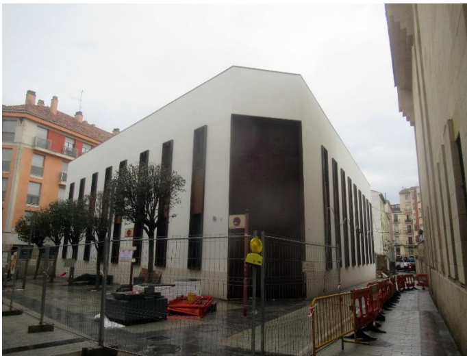
Colegio san Bernabé