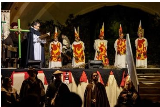
Auto de fe Brujas de Zugarramurdi