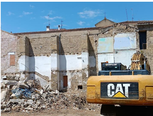
Derribo Convento Madre de Dios