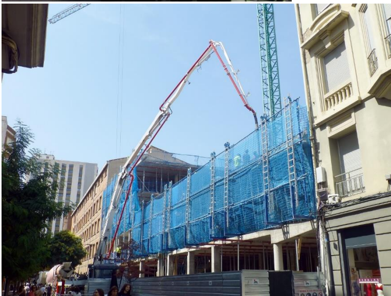
Derrumbe y nueva construcción en Adoratrices