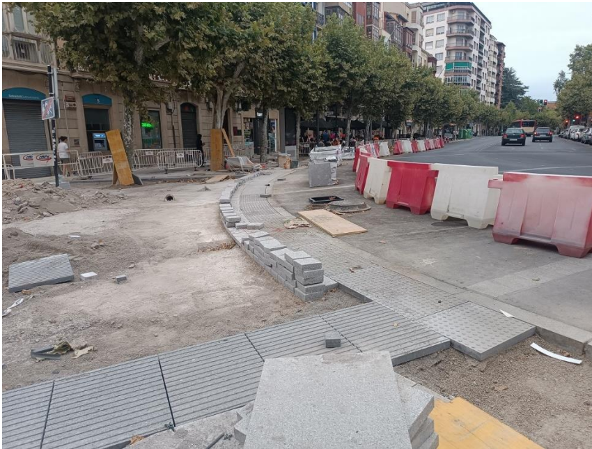
Reurbanización la Glorieta