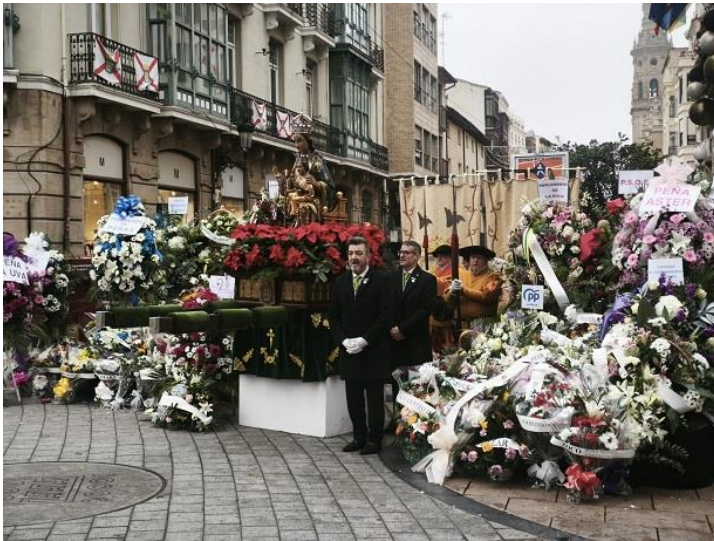
Ofrenda Virgen de la Esperanza