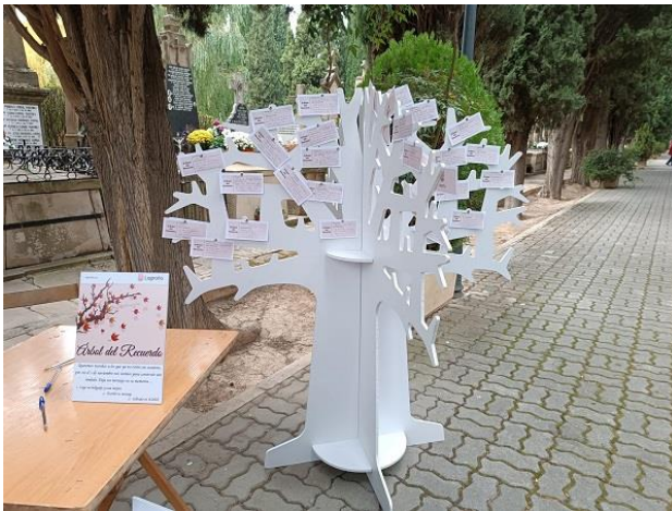
Árbol del recuerdo