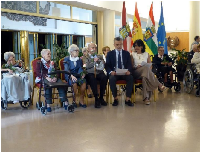
Homenaje a nuestros mayores