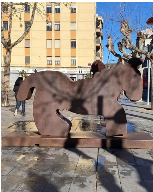
Exposiciones en la calle