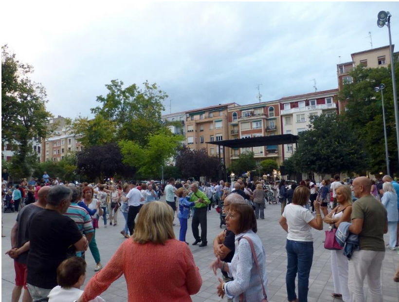
Bailando en plata