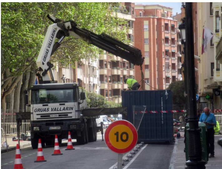
Reurbanización Duquesa de la Victoria