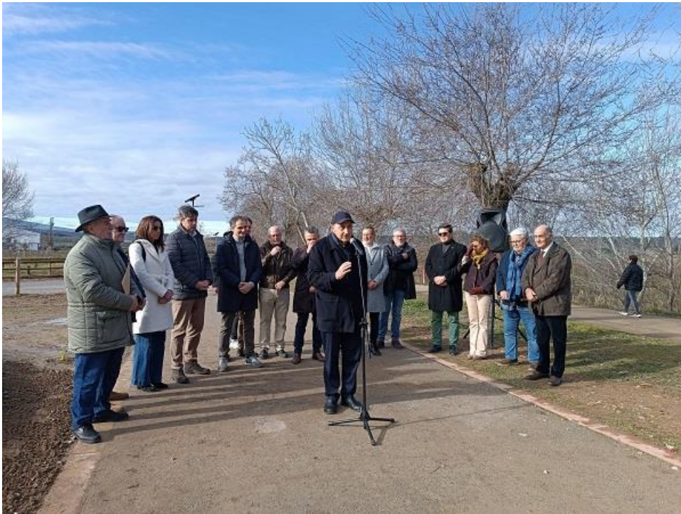
Inauguración Parque del Camino