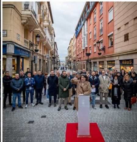
Reurbanización de Sagasta