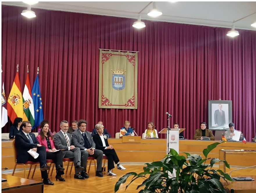
Estrella de Europa