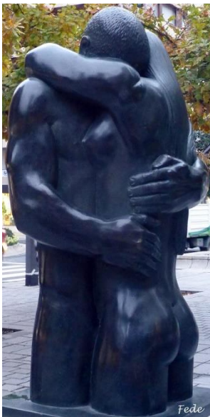
Plaza Dalmati y Narvaiza. El Abrazo