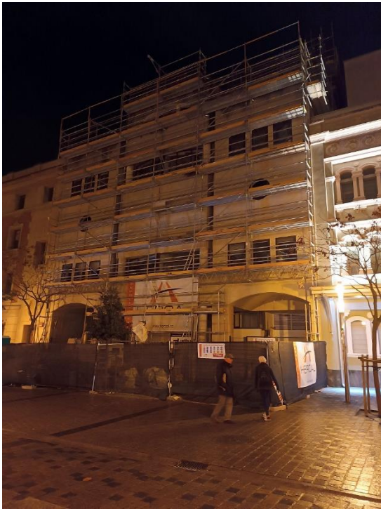
Derribo de los juzgados