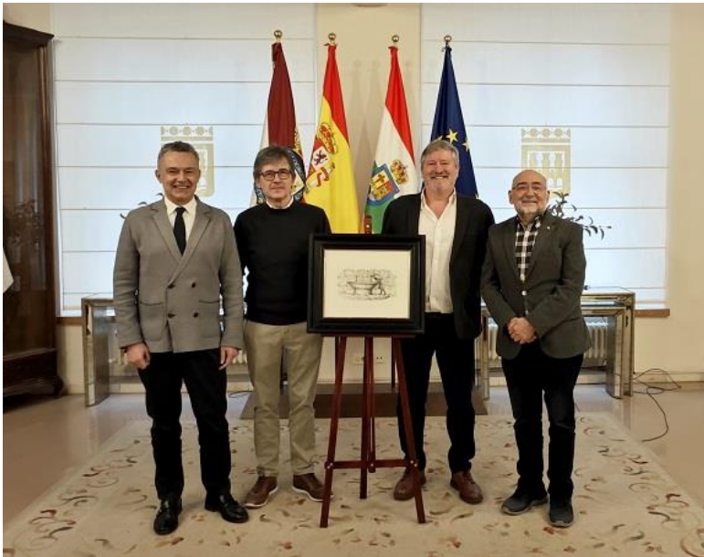
Premio Narrativa De Buena Fuente