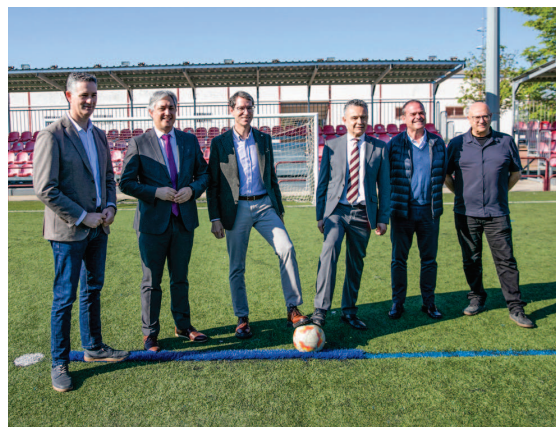
■ El Ayuntamiento de Logroño y la Comunidad autónoma de La Rioja colaboran en el proyecto.

Este edificio social incluirá salas de reuniones, cuartos técnicos, despachos, aseos, entradas separadas para cada campo, taquillas independientes y conserjería. La tribuna central contará con graderíos, vestuarios, almacenes y salas polivalentes y de mantenimiento. Los graderíos tendrán una capacidad aproximada para 736 y 1.684 personas respectivamente, con la posibilidad de ampliarse para alcanzar hasta 1.000 y 2.000 localidades.