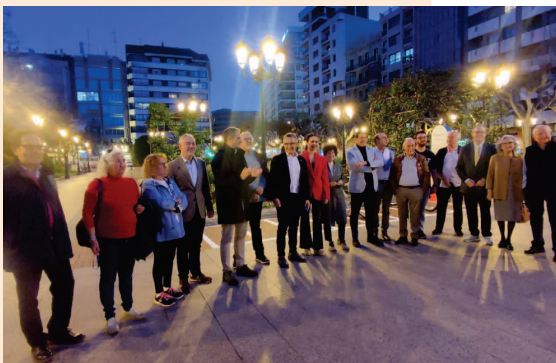
■ Momento de la puesta en marcha de la iluminación.

El alcalde enmarcó este “esfuerzo intenso que estamos haciendo en transformar y embellecer Logroño” en el impulso de la