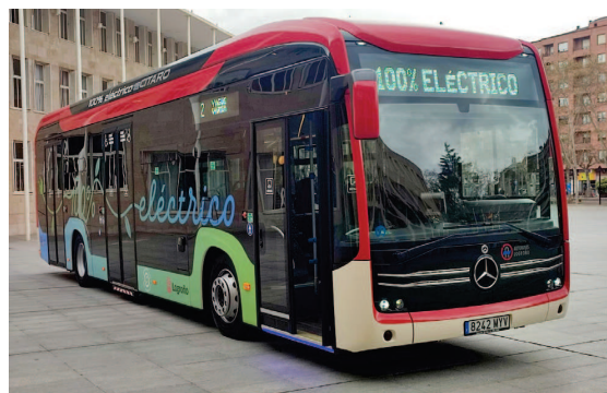
■ Nuevo autobús eléctrico del servicio municipal.

El alcalde destacó en su presentación que “seguimos mejorando los medios de transporte urbano al servicio de los logroñeses, no sólo con la renovación de sus vehículos, sino con todos los valores añadidos que aportan estas innovaciones. Dando un servicio más sostenible, que reduce las emisiones a la atmósfera, más confortable, reduciendo ruidos, más accesible, con las mejoras introducidas en esa materia, y