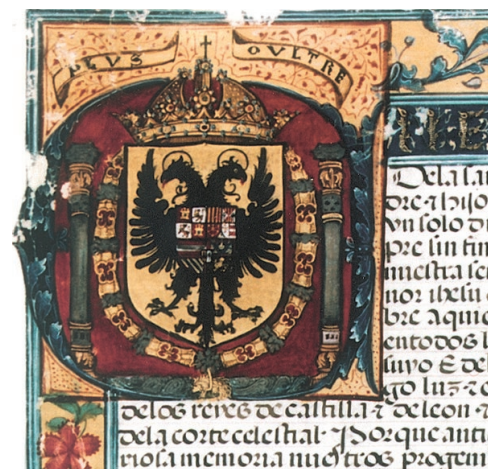
■ Detalle del Privilegio de exención de la moneda forera.