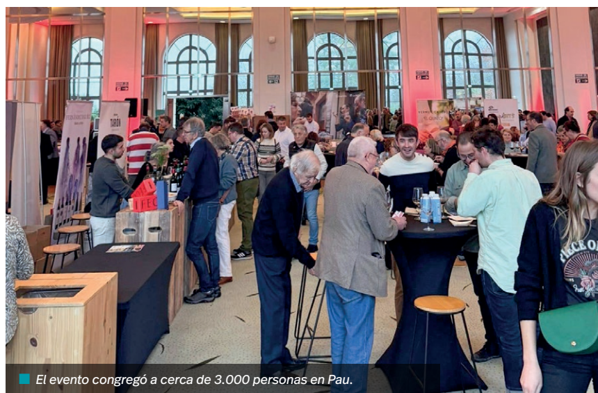
El evento congregó a cerca de 3.000 personas en Pau.