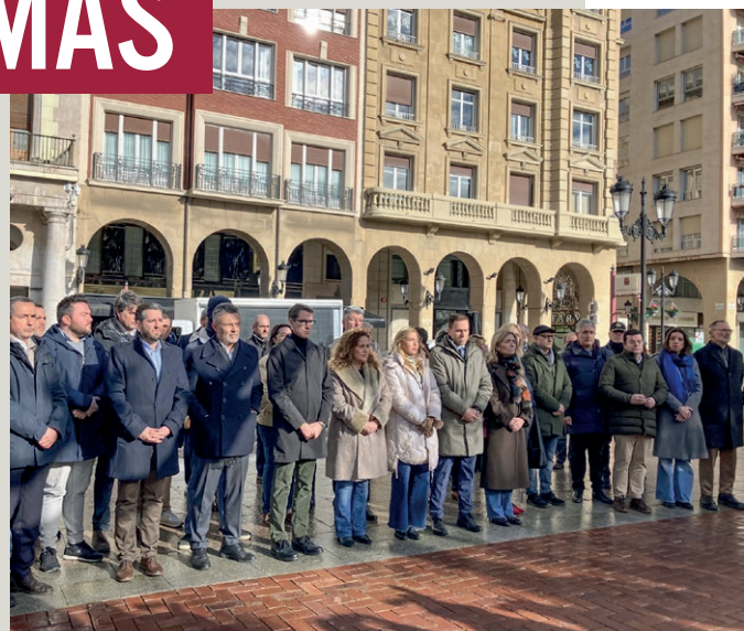
El alcalde de Logroño y otros miembros de la Corporación participaron en el minuto de silencio.

Del mismo modo, las banderas del Ayuntamiento permanecieron a media asta en señal de duelo por las víctimas de este accidente.