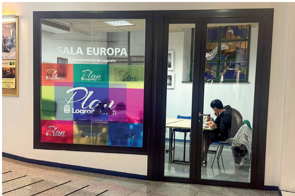
■ La Sala Europa de La Gota de Leche es uno de los espacios habilitados.

El Centro Infanto Juvenil La Atalaya dispone de una sala habilitada para el estudio, con 30 plazas. Los centros jóvenes de Lobete (sala de oficina), El Tacón (sala de