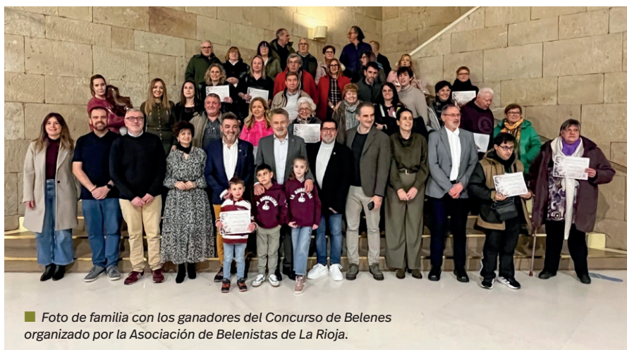
Foto de familia con los ganadores del Concurso de Belenes organizado por la Asociación de Belenistas de La Rioja.