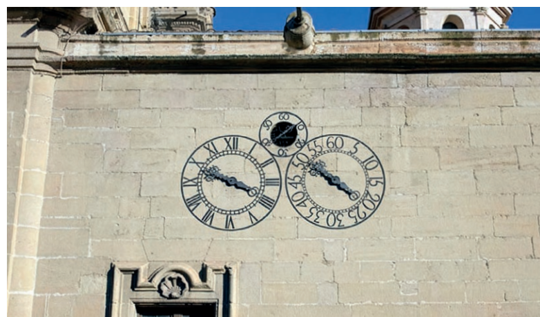
Reloj de tres esferas.