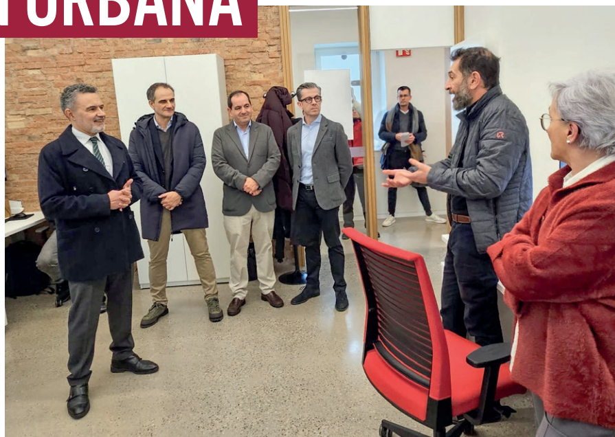
El alcalde visitó la sede de Tragsatec en el Colegio San Bernabé.

“El objetivo es ofrecer un espacio para el desarrollo de ideas de negocio de emprendimiento y de empresas recién constituida, formación, o nuevos profesionales autónomos. Se busca fomentar espacios de trabajo adaptados a la flexibilidad que hoy en día necesitan las empresas y los profesionales. Busca-