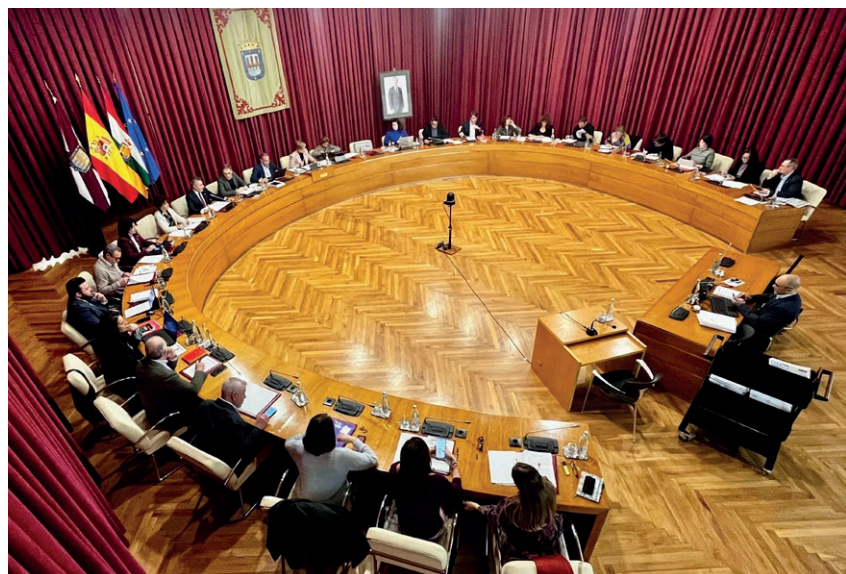
■ El Pleno del Ayuntamiento de Logroño aprobó el 5 de febrero iniciar el proceso de hermanamiento con la ciudad palestina de Belén.

Desde el Ayuntamiento de Logroño se subraya el “claro interés público” para este hermanamiento, “sustentado en elementos de interés cultural y patrimonial, turístico, de promoción internacional, educativo y social, y de participar en proyectos de cooperación técnica”.