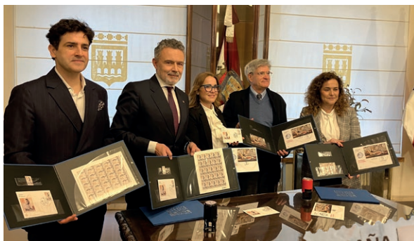
■ El Ayuntamiento acogió la presentación de los sellos dedicados a María Teresa León y a las patatas a la riojana.

E l Ayuntamiento de Logroño acogió los actos de presentación y matasellado de dos nuevos sellos de Correos muy vinculados a la cultura e identidad riojana. Uno de ellos, a la escritora logroñesa María Teresa León (1903-1988). Ensayista, dramaturga y activista cultural, formó parte del grupo de intelectuales conocido como 'Las Sinsombrero'.