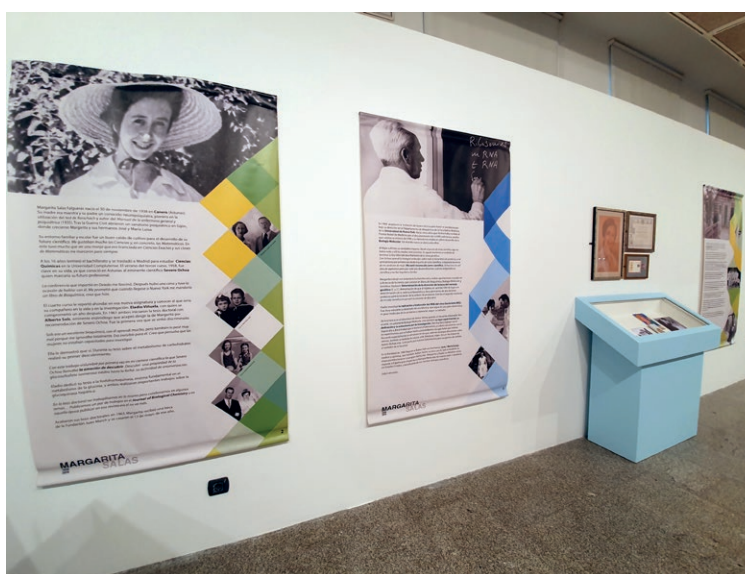
■ Imágenes de la exposición 'Ciencia con nombre de mujer' en la Casa de las Ciencias.