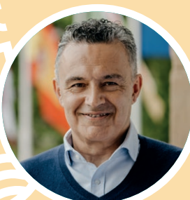
Conrado Escobar Las Heras. Alcalde de Logroño

Fomentar la salud y el bienestar de la población promoviendo estilos de vida saludables en nuestra ciudad es una de las prioridades para el Ayuntamiento de Logroño. De la mano de otras administraciones, entidades y asociaciones debemos seguir trabajando para crear un entorno social y medioambiental cada vez más adecuado donde las opciones saludables sean las más fáciles de elegir.