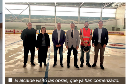
■ El alcalde visitó las obras, que ya han comenzado.

Y a han comenzado las obras de mejora del CDM Lobete con un proyecto centrado en la modernización de sus sistemas técnicos y la renovación energética del edificio. La actuación, impulsada por el Ayuntamiento de Logroño en colaboración con el Gobierno de La Rioja y financiada con fondos europeos FEDER, supondrá una inversión superior a los 2,4 millones de euros.