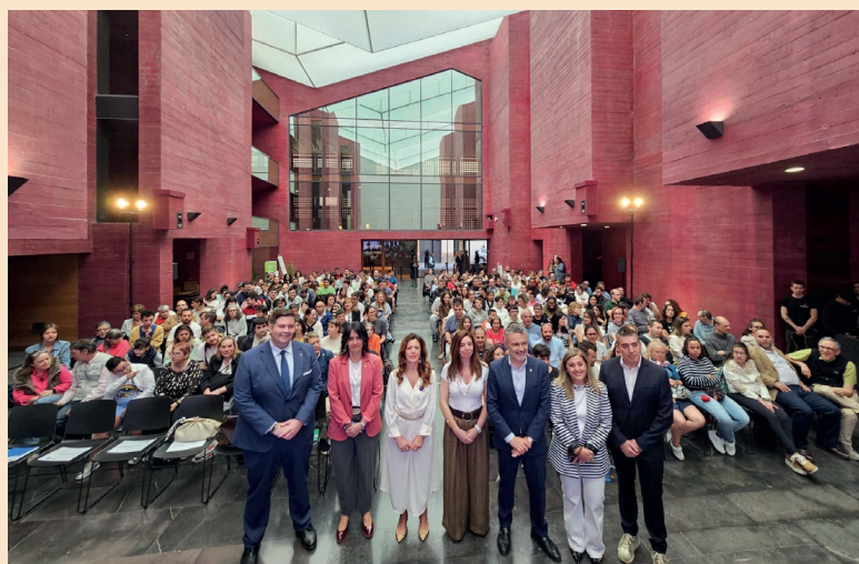
■ Fotografías del encuentro ‘Con Voz Propia’.

Para Plena inclusión La Rioja, este encuentro es muy importante, porque es un espacio para escuchar, compartir y construir juntos una sociedad más justa, accesible e inclusiva.