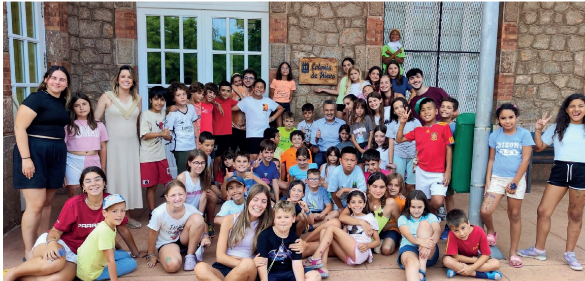
■ Imagen de uno de los campamentos celebrado el pasado verano.

Por su parte, el campamento marítimo en el Albergue El Timón de Llanes (Asturias) contará con 50 plazas para niños de 12 y 13 años y tendrá lugar entre el 20 y el 29