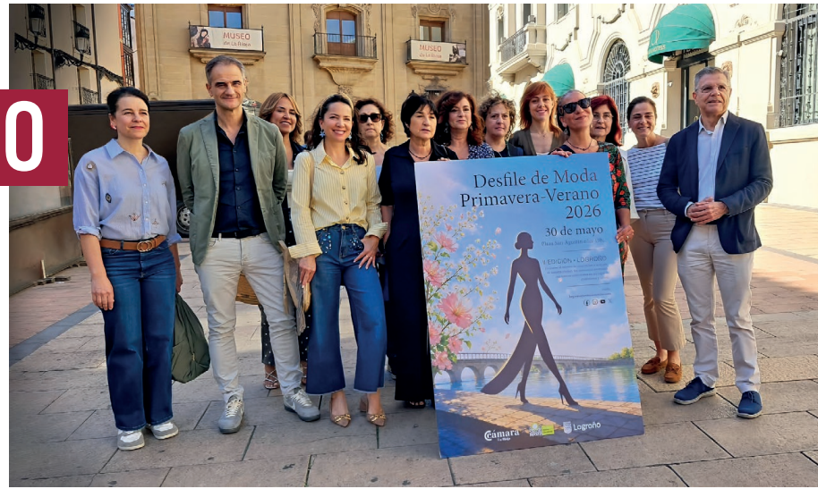
Presentación del Desfile de Moda Primavera-Verano 2026.

El desfile está organizado por el Ayuntamiento de Logroño y la Cámara de Comercio y forma parte del plan de apoyo y dinamización del comercio local.