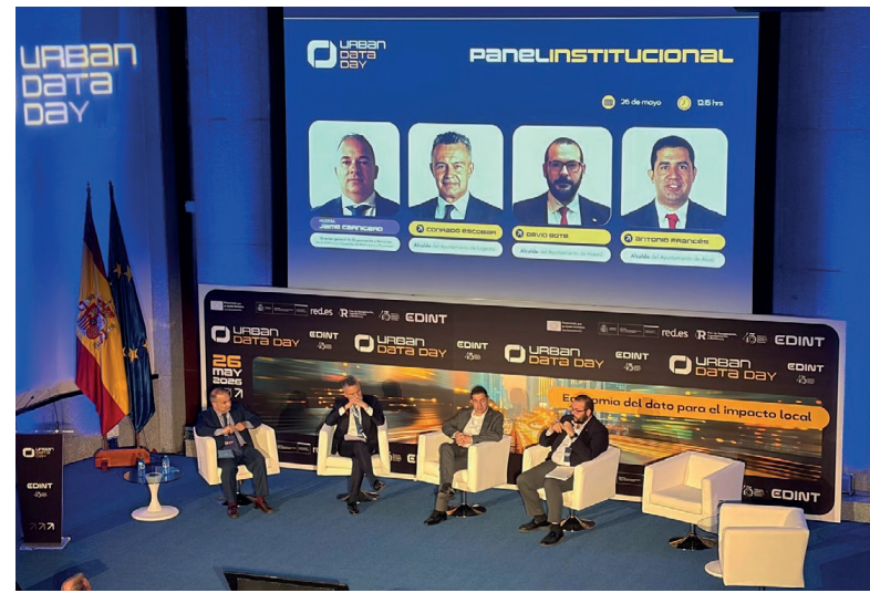
El alcalde de Logroño presidirá la Red Española de Oficinas del Dato.

cales seleccionadas para ejecutar esta iniciativa, con una financiación estimada de 12,96 millones de euros procedentes de fondos europeos Next Generation. El objetivo del Proyecto EDINT es generar valor público continuo mediante soluciones tecnológicas que resuelvan problemas cotidianos de la ciudadanía.