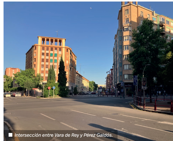
Intersección entre Vara de Rey y Pérez Galdós.

euros. La nueva glorieta y la reordenación del espacio público en este punto permitirá mejorar la movilidad y seguridad vial en la zona centro, favoreciendo además los tránsitos peatonales a arterias comerciales como la calle San Antón, así como a infraestructuras municipales como el nuevo centro intergeneracional y polivalente ubicado en la antigua estación de autobuses.