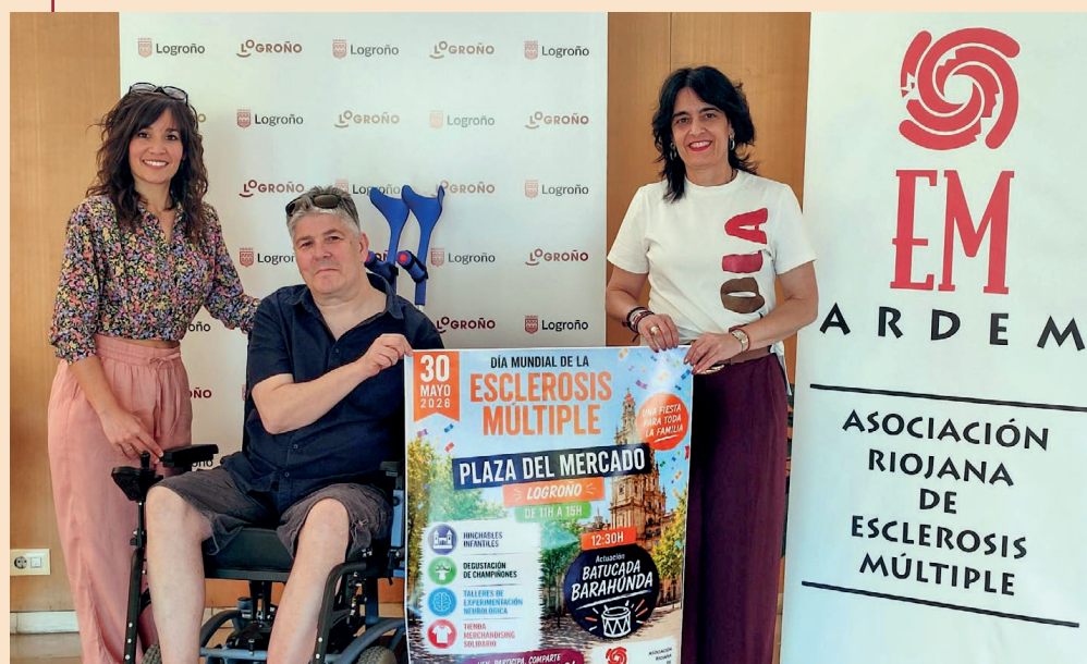
Presentación de la jornada por el Día Mundial de la Esclerosis Múltiple.

Será un día de convivencia y apoyo social.