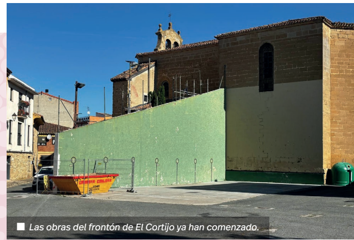
Las obras del frontón de El Cortijo ya han comenzado.

El proyecto actuará también sobre el fron-