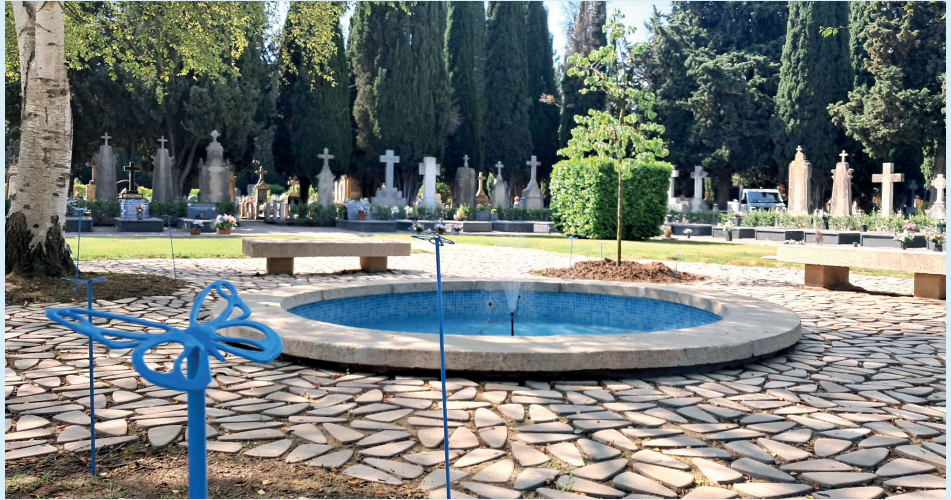
■ Imagen del nuevo espacio perinatal del cementerio de Logroño.

El alcalde de Logroño, Conrado Escobar, afirmó que “siendo conscientes de la dureza del contexto y con el máximo respeto, desde el Ayuntamiento se ha buscado que este espacio verde sea lo más acogedor posible, en pro de hacer más llevadero el duro trance”.