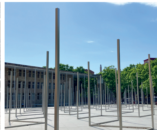
■ Proceso de montaje de instalaciones en la plaza del Mercado, Gran Vía con San Antón y plaza del Ayuntamiento.