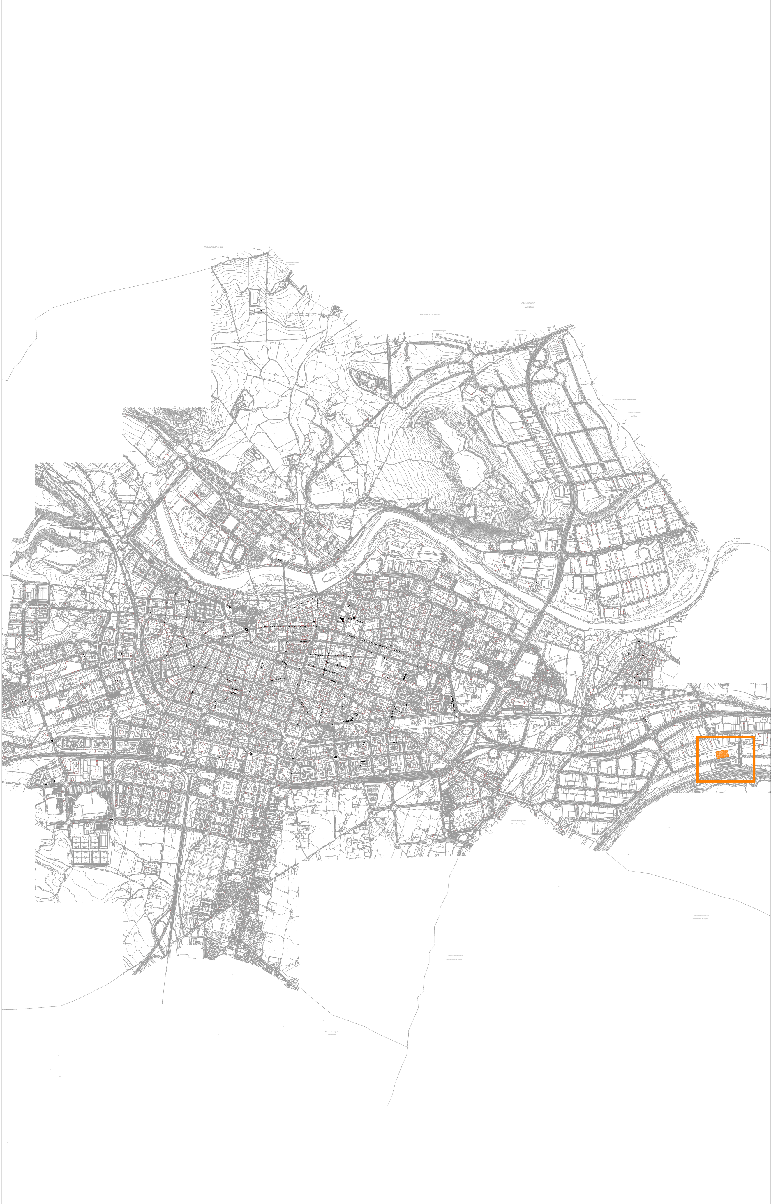
SITUACIÓN e : 1/20.000