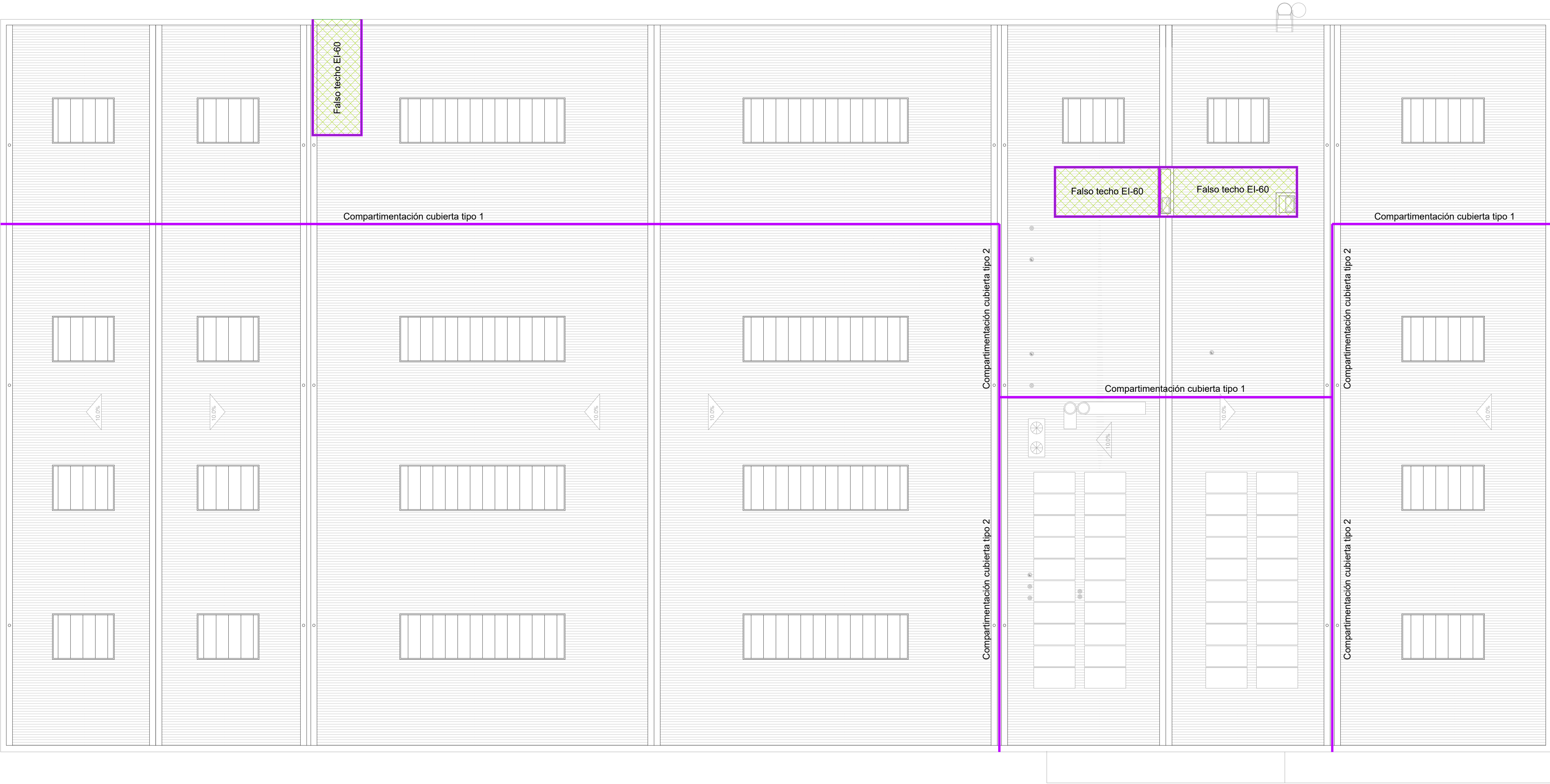
Compartimentación cubierta tipo 1