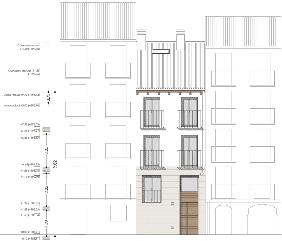
ALZADO SUR C/Ollerías