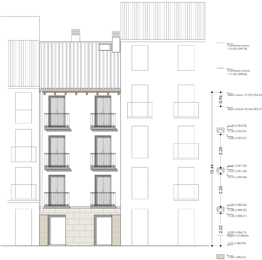
ALZADO NORTE C/ SAN JUAN