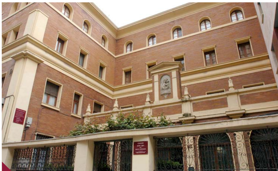
Diario La Rioja

Allí estuvieron hasta 1911, fecha de su traslado a su segunda sede en la calle Once de Junio hasta 1957, cuando el Banco de España vuelve a trasladarse a su tercera y actual ubicación. Después de 126 años de historia, el Banco de España abandona en 2011 su representación en Logroño al cerrar la sede de General Vara de Rey.